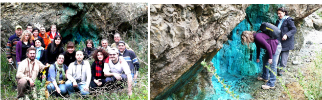
L'escursione si è conclusa al restaurato castello di Santo Niceto.

Attraverso un tortuoso percorso non sempre facilmente individuabile a causa della folta vegetazione e di alcune frane lungo i pendii, un gruppo di Soci Kronos ha raggiunto la parete di un azzurro intenso, a monte di Trunca.