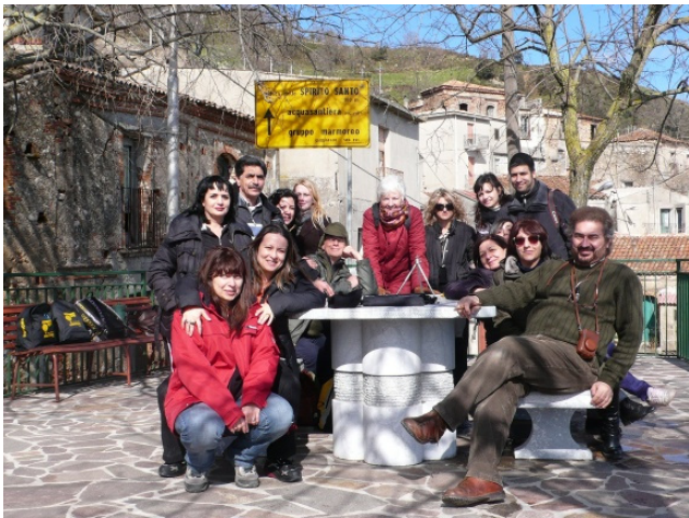
PIETRA PENNATA: PIAZZETTA DEL CENTRO: ALCUNI SOCI DURANTE UNA PAUSA

Un'escursione culturale e naturalistica nella cittadina jonica che sorge sulle rive dell'omonima fumara (attraversata da un caratteristico ponte in pietra), ai piedi del Castello in fase di restauro.