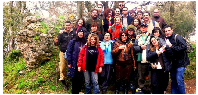
ALCUNI DEI SOCI NEI PRESSI DI UN RUDERE DI PIANO CASCIANO

Alle porte del Parco Nazionale dell'Aspromonte: San Giorgio Morgeto, una cittadina dalle caratteristiche strette vie arricchite da innumerevoli scale e vicoli (alcuni dei quali raggiungono la larghezza minima di appena 40 centimetri). La cittadina è stata visitata in un pomeriggio di densa nebbia, che ha impedito l'ottimale visione del Castello, dei Palazzi Fazzari, Ambesi, Florimo e Corrales, delle Chiese di Sant'Antonio da Padova, di Santa Maria Assunta, di Santa Maria della Pietà, di Santa Maria del Carmine, e del Convento dei Domenicani. La visita del borgo è stata preceduta da un'escursione a Monte Palombaro ed a Monte Campanaro, alla riscoperta del Piano Casciano dove sorgeva l'antica Altanum, utilizzata dai Lo cresi per il controllo degli abitanti tirrenici della Piana.