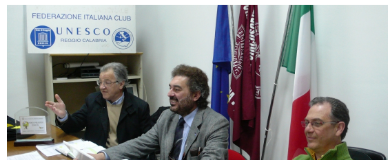
I MASSIMI ESPONENTI DEL CLUB UNESCO REGGINO DURANTE L'INIZIATIVA GIOVANI INSIEME

La XXX Assemblea si svolge nel 2009 a Cagliari, in Sardegna, con la presenza di tutti i delegati degli oltre cento Club UNESCO operanti in Italia.